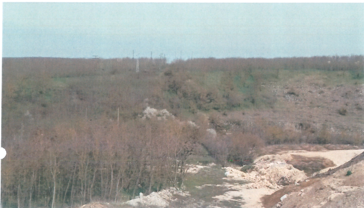
Снимка 1: Общ вид на площта за проучване

Минно-техническите условия и изисквания за качество, при които са изчислени запасите от варовици в находище „Хитрино 4“ са следните: